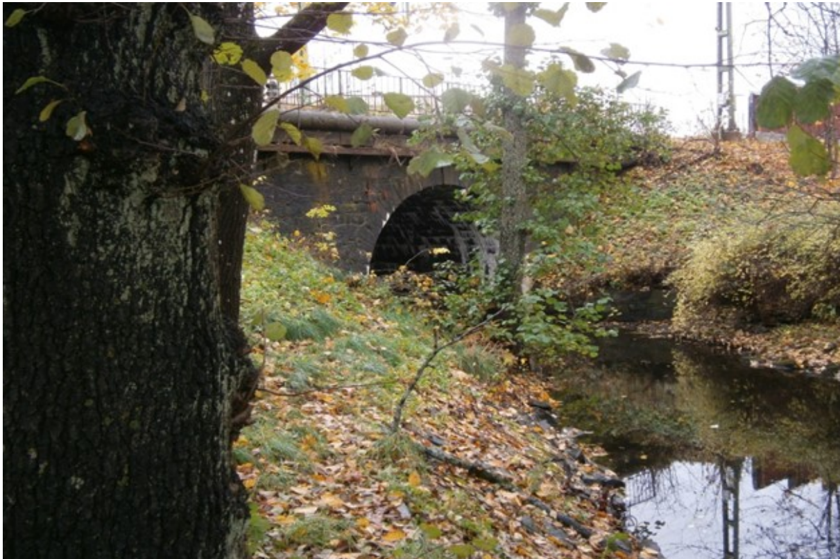
Den kulturminnesmärkta järnvägsbron nedströms nära Stampens kvarn

Apropå kulturminnesskyddat så är den vackra järnvägsbron nedströms kvarnen också förklarad som byggnadsminne. Den byggdes då järnvägen anlades d.v.s. runt på 1850-talet och är typ stenalvsbro och vid upprustningen av järnvägen, som pågår, kommer den att förstärkas dock med den restriktionen att inget av dess yttre får förändras.